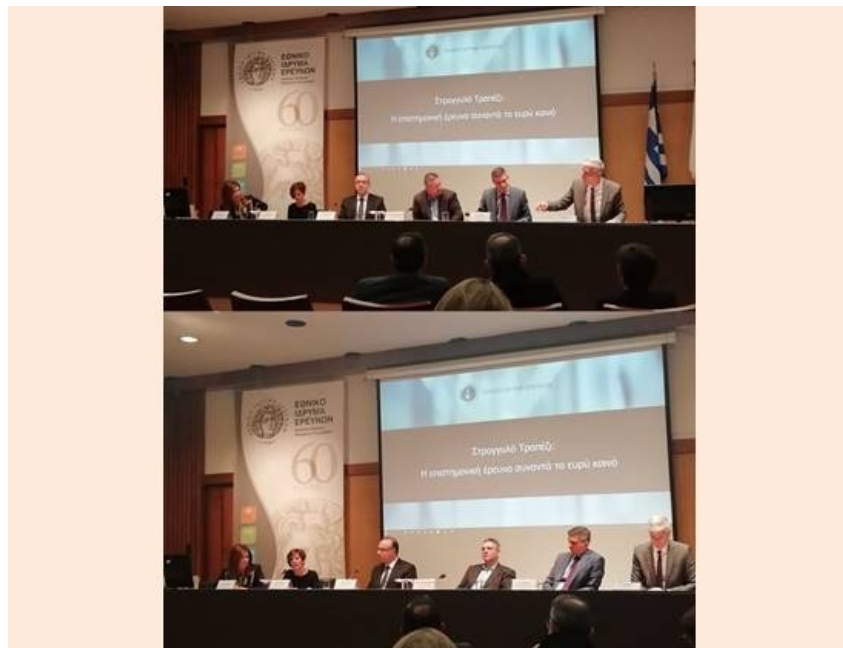
Στρογγυλό Τραπέζι: Η επιστημονική έρευνα συναντά το ευρύ κοινό