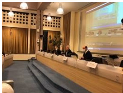
Επίσκεψη του ΓΓΕΚ, Καθ. Αθ. Κυριαζή στο CERN