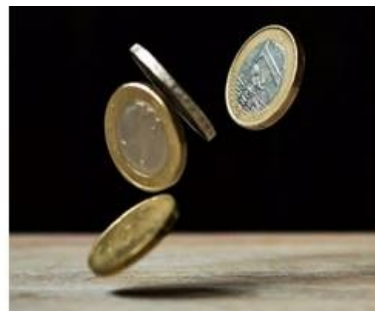
Υπεγράφη από τον Γενικό Γραμματέα Ε&Κ η πρόσκληση