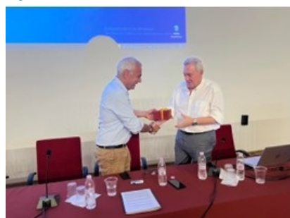
Ομιλία του ΓΓΕΚ, Καθ. Αθανάσιου