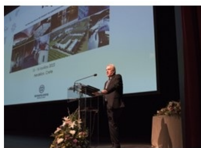
Συμμετοχή του ΓΓΕΚ, Καθ. Αθανάσιου Κυριαζή στην 13η Επιστημονική Διημερίδα του ΙΤΕ