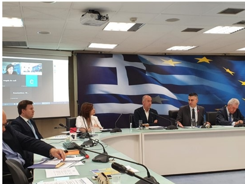
Συνάντηση εργασίας της Ευρωπαϊκής Επιτροπής και των αρμόδιων φορέων της Ελλάδας για τη διενέργεια διμερούς διαλόγου σε θέματα πολιτικής του Ευρωπαϊκού Χώρου Έρευνας και Καινοτομίας (Enhanced Bilateral Dialogue between Greece and the EU)