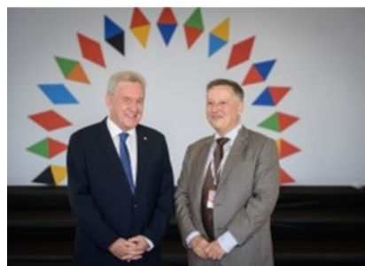
Συμμετοχή του ΓΓΕΚ, Καθ. Αθανάσιου Κυριαζή στην Άτυπη Υπουργική συνάντηση για την Ανταγωνιστικότητα και την Έρευνα