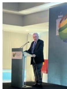
Συμμετοχή του ΓΓΕΚ, Καθ.