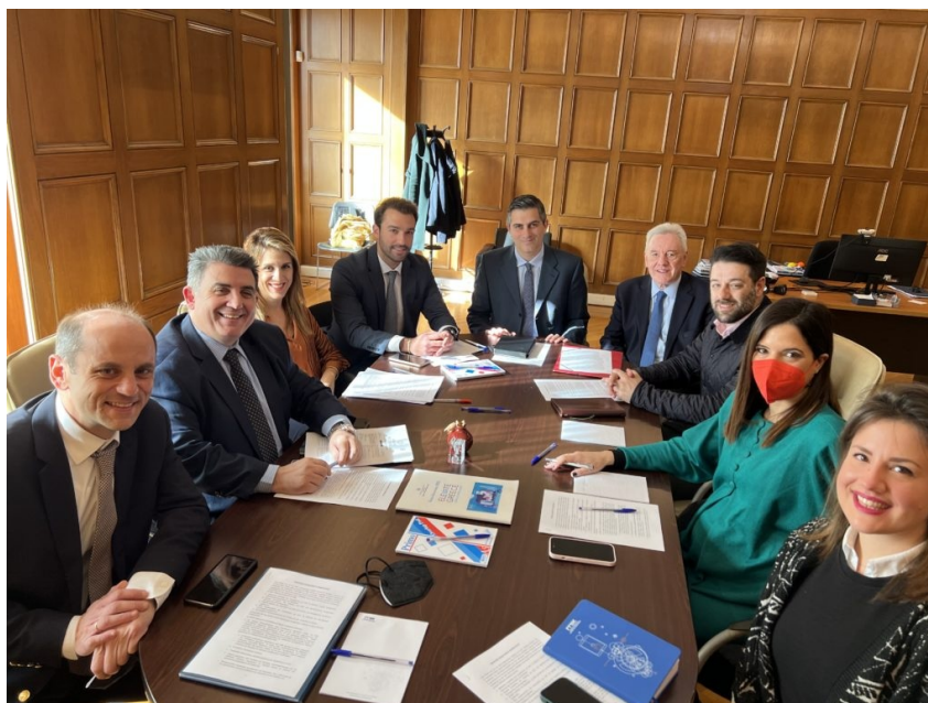
Ξεκίνησε επίσημα η λειτουργία της Elevate Greece A.E.

ΗΛΕΚΤΡΟΝΙΚΗ ΕΝΗΜΕΡΩΤΙΚΗ ΕΚΔΟΣΗ | #45 Φεβρουάριος 2023