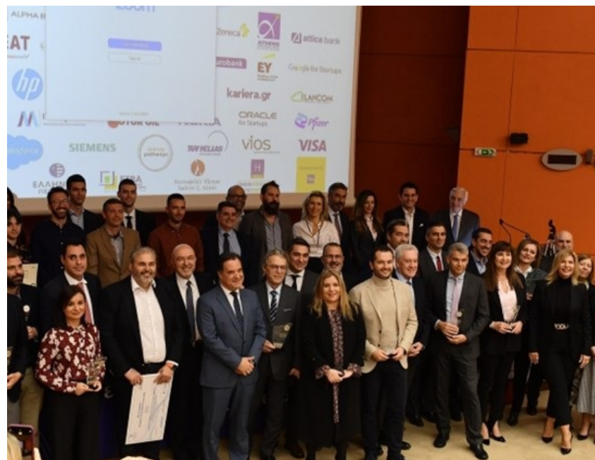
Απονομή Εθνικών Βραβείων Νεοφυούς Επιχειρηματικότητας Elevate Greece 2022