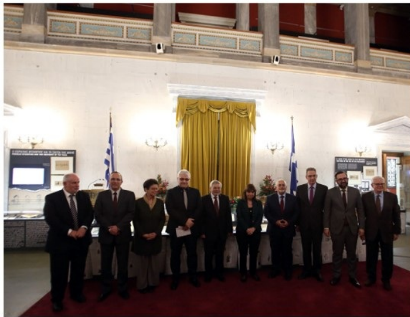
Στους καθηγητές Μιχαήλ Φαρδή και Λάμπρο Λιάβα το Βραβείο Εξαιρετης Πανεπιστημιακής Διδασκαλίας του ΙΤΕ