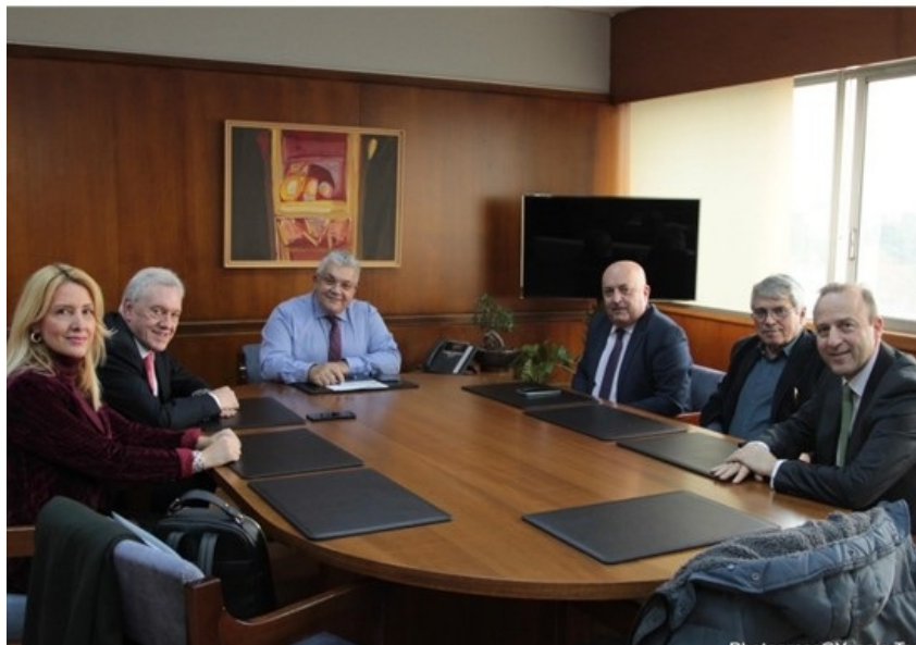
Συνάντηση των Πρυτανικών Αρχών του ΑΠΘ με τον Γενικό Γραμματέα Έρευνας και Καινοτομίας | Δελτίο Τύπου ΓΓΕΚ