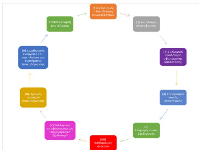
Διάγραμμα 2 Ο Κύκλος της διακυβέρνησης