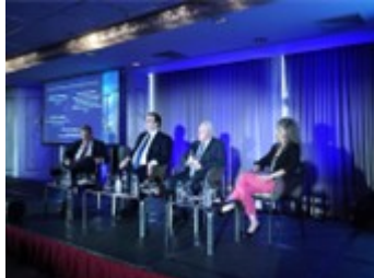
Συμμετοχή του Γενικού Γραμματέα Έρευνας και Καινοτομίας (ΓΓΕΚ), κ. Αθανάσιου Κυριαζή στο 3rd Quo Vadis AI Conference