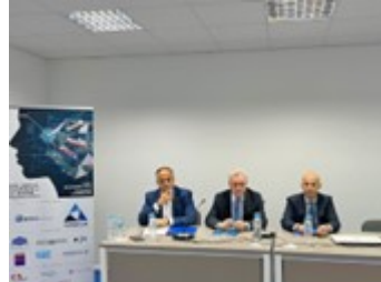
Παρουσία του ΓΓΕΚ πραγματοποιήθηκε η συζήτηση στρογγυλής τραπέζης: «The development of a strategic plan for the transformation of Greece into a marine technology hub»