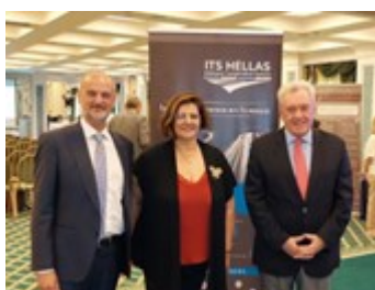
Το παρόν έδωσε ο ΓΓΕΚ στο 9ο ετήσιο συνέδριο της ITS Hellas “Intelligent transport Systems in Greece: Explore. Innovate. Transform”