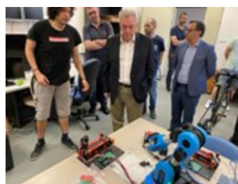
Επίσκεψη του ΓΓΕΚ σε ερευνητικούς φορείς στην Πάτρα