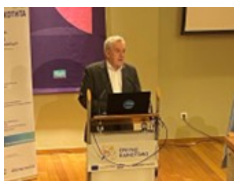
Ο ΓΓΕΚ συμμετείχε στην ενημερωτική εκδήλωση για τη Δράση Στρατηγικής Σημασίας «ΕΡΕΥΝΩ – ΚΑΙΝΟΤΟΜΩ»