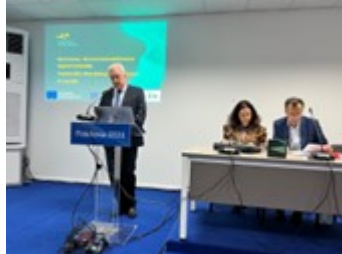
Χαιρετισμός του ΓΓΕΚ σε workshop με θέμα: “Blue Economy – The key towards Mediterranean Regional Sustainability” «Ποσειδώνια 2024»