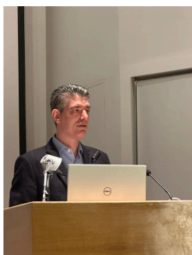
Τάσος Γαϊτάνης: «Επεκτείνουμε την Εμβληματική Δράση για την αντιμετώπιση του ιού SARS-