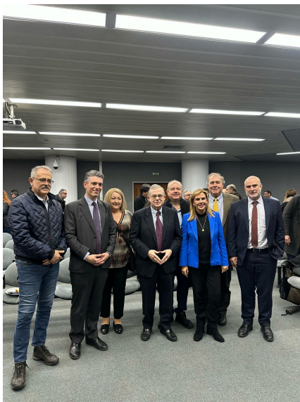
Κοπή Πρωτοχρονιάτικης Πίτας ΓΓΕΚ

Έγκριση Αποτελεσμάτων Αξιολόγησης των αιτήσεων χρηματοδότησης ερευνητικών έργων της Δράσης «Ερευνώ-Καινοτομώ» του Προγράμματος «Ανταγωνιστικότητα» ΕΣΠΑ 2021-2027 (Κωδικός Πρόσκλησης 08ΚΕ – Κωδικός ΟΠΣ 9833) της Παρέμβασης IV: «Σφραγίδα Αριστείας (Seal of Excellence) για επιχειρήσεις»